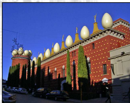
Muzeum Salvadora Dalího

Katalánsko – to je skalnaté pobřeží, dlouhé písčité pláže, hory, nížiny a lesy. Katalánsko – rodiště umělců jako byl Salvador Dalí, Joan Miró a neopomenutelný architekt Antonio Gaudí, jehož modernistické stavby zdobí hlavní město Katalánska – Barcelonu.