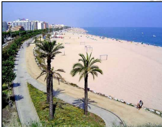
Costa del Maresme